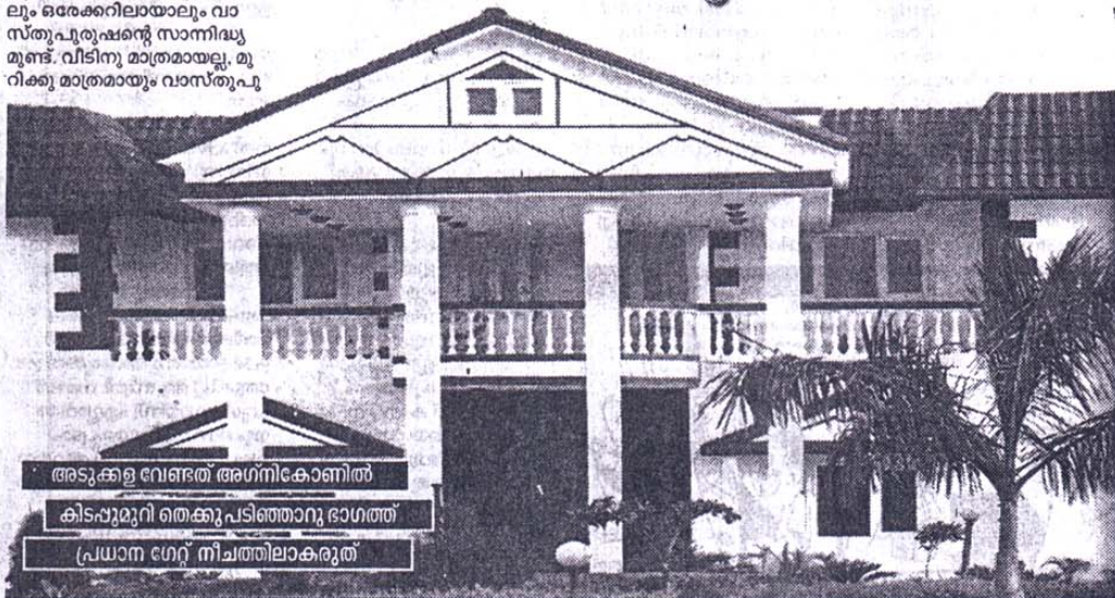
അടുക്കള വേണ്ടത് അഗ്നികോണിൽ കിടപ്പുമുറി തെക്കുപടിഞ്ഞാറു ഭാഗത്ത് പ്രധാന ഗേറ്റ് നീചത്തിലാകരുത്